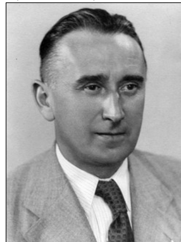
Ladislav Feierabend (* 14.6.1891 - † 15.8.1969)