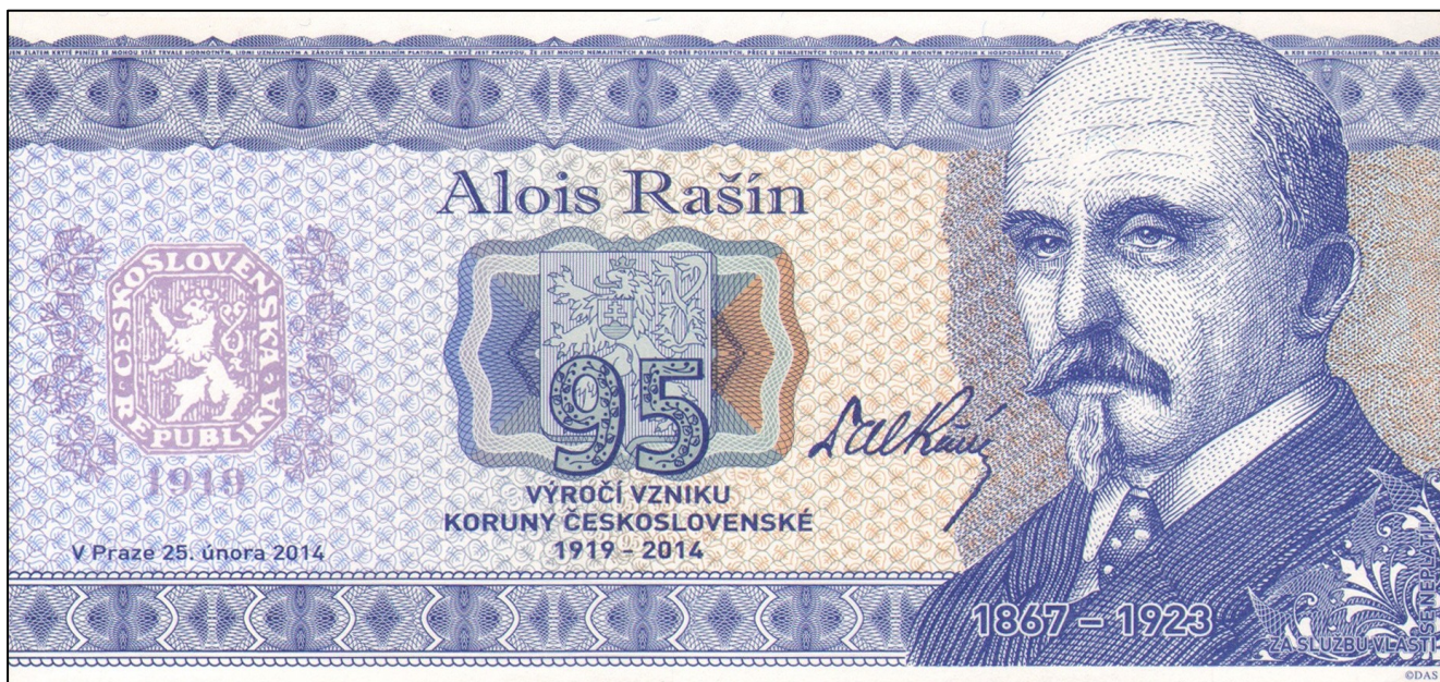
Druhá emise pamětních bankovek z řady „Muži 28. října“, která připomíná nejen Aloise Rašína, ale významné výročí vzniku naší měny