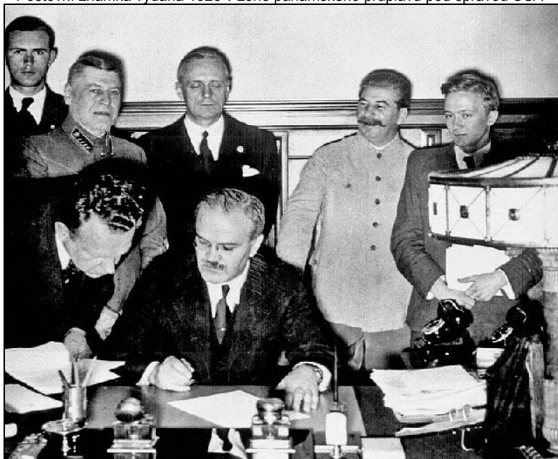
Vyacheslav M. Molotov při podpisu paktu Ribbentrop-Molotov 23. srpna 1939 v Moskvě