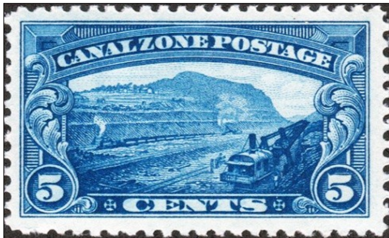
Poštovní známka vydaná 1928 v zóně panamského průplavu pod správou USA