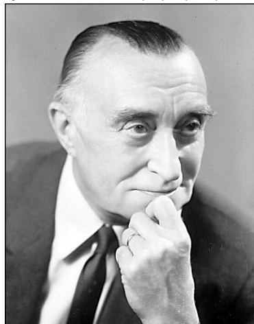
Oldřich Nový (* 7.8.1899 - † 15.3.1983)